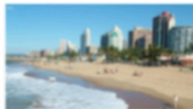
UNE VILLE QUI SE DEVELOPPE GRACE A PLUSIEURS ACTIVITES.