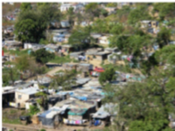
UNE VILLE AVEC DE GRANDES INEGALITES.