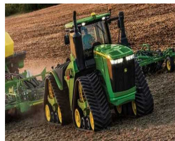
3) JOHN DEERE 9620-R-X