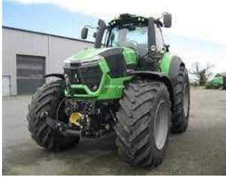
10) DEUTZ FAHR 9340