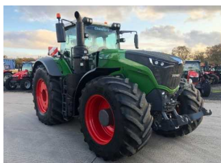
7) Fendt 1050 VARIO