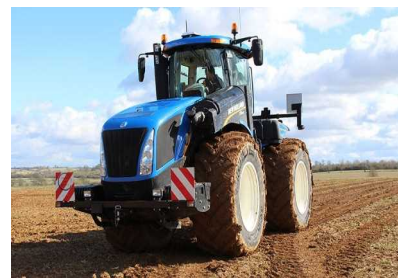
2) NEW HOLLAND T9-700