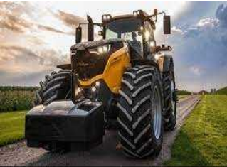
9) CHALLENGER 1050