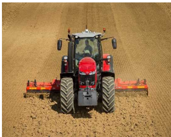
8) MASSEY FERGUSON M-F-87