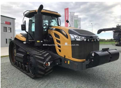
6) CHALLENGER M-T-875