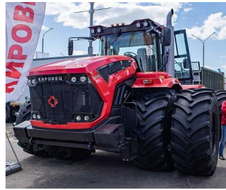
5) KIROVETS K-742