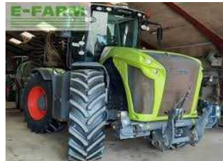
4) CLAAS XERION 5000